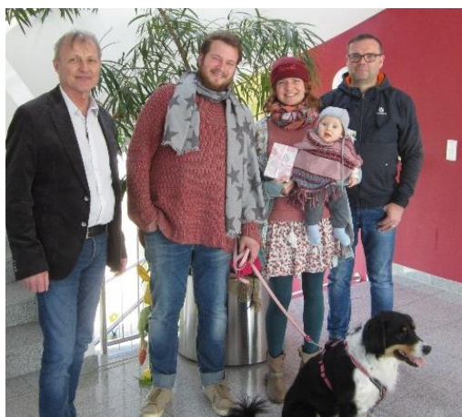
Geburt von Raff Kara