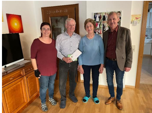
Goldene Hochzeit Fam. Geider