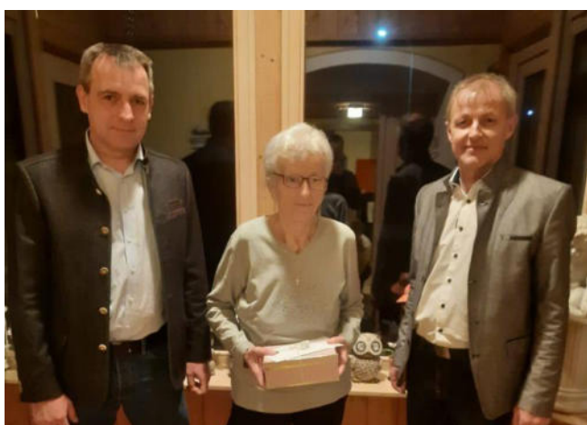
85. Geburtstag von Sommer Helene