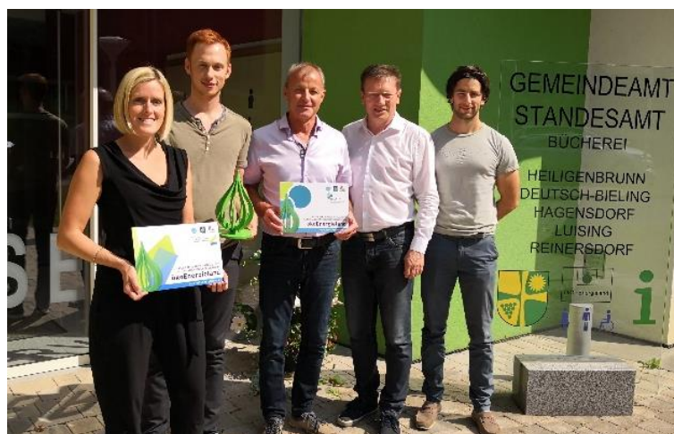
Als Zeichen der Mitgliedschaft wurden die Tafeln für die Klima- Energiermodellregion sowie für die Klimawandelanpassungsregion übergeben