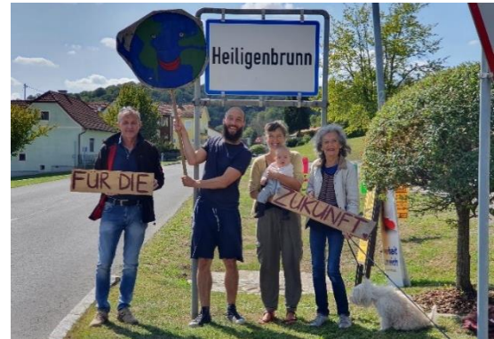
Klimaaktion in Heiligenbrunn „Fridays for Future“