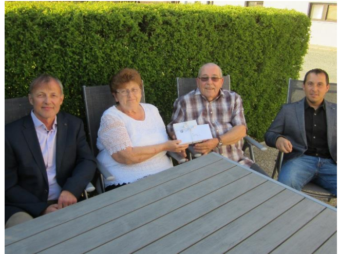
Fam. Schendl, Goldene Hochzeit